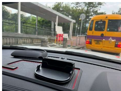
青山公路-嶺南段 巴士站