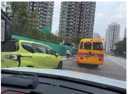
元朗-YOHO TOWN 的士站