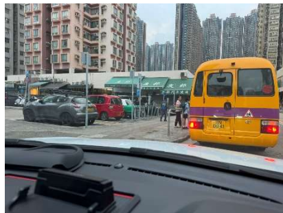
鳳悠北街-順豐大廈